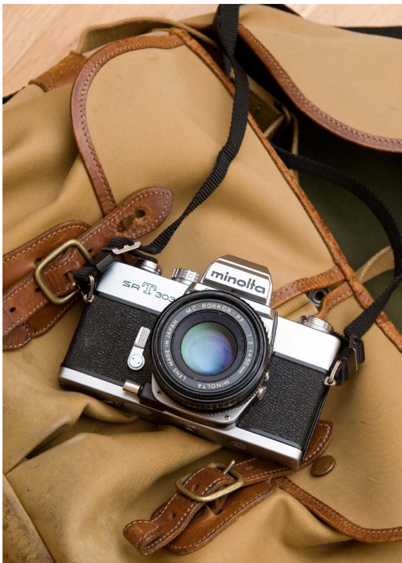
Abbildung 3.5: Eine Minolta SRT 303 mit dem Rokkor 2/50 mm. Die in den 60er und 70er Jahren beliebte SRT-Kamerareihe erfreute den Benutzer durch einfache Handhabung und hohe Zuverlässigkeit. Minolta-Objektive und im Besonderen das hier aufgesetzte 50-mm-Objektiv zeichnen sich durch eine hohe optische Qualität aus. Leider existiert diese einst große Marke wie so viele andere nicht mehr als Kamerahersteller.