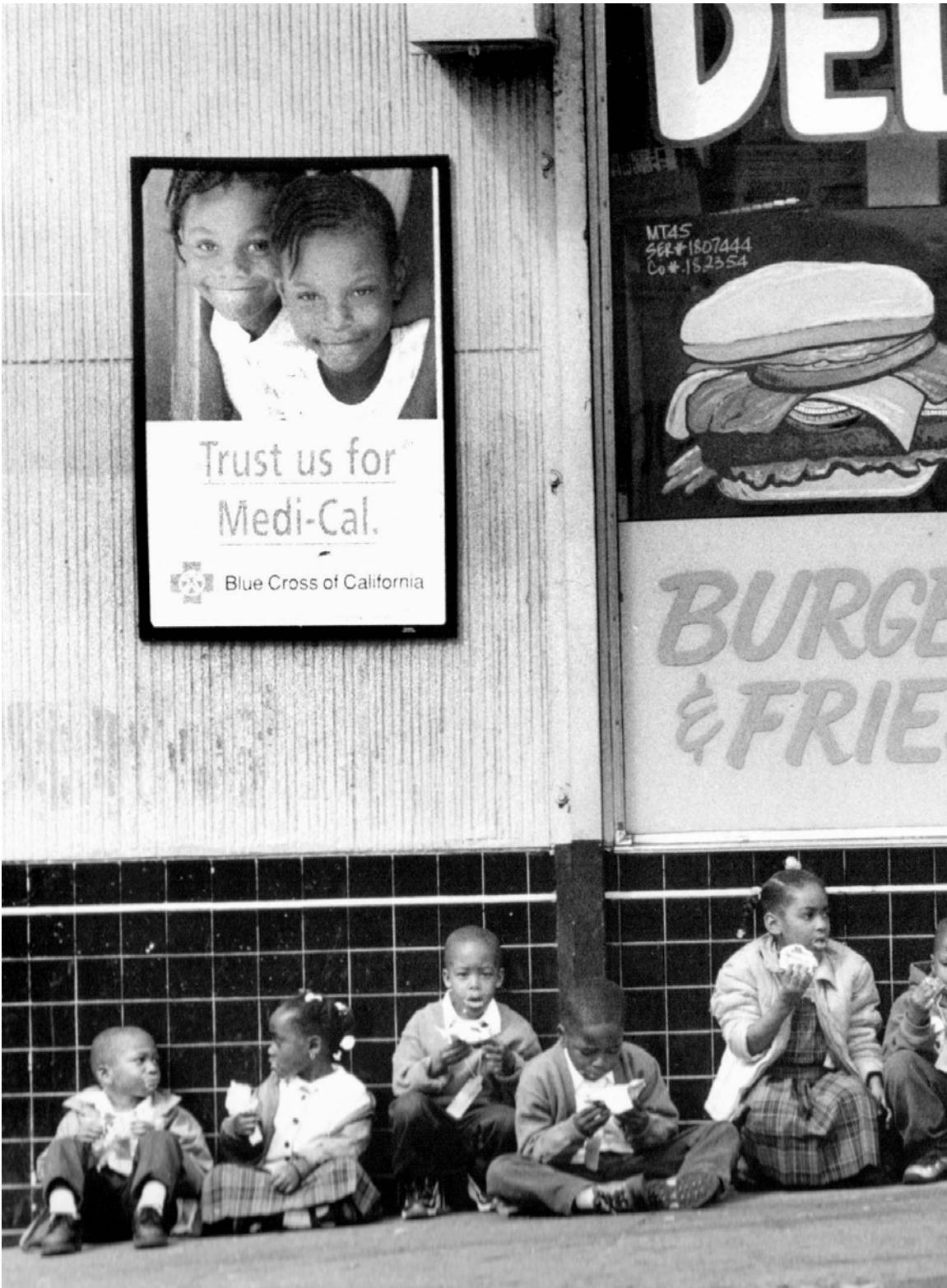
Abbildung 3.8: Essenspause, San Francisco, 1998. Leica, 180 mm, Kodak TRI-X 400