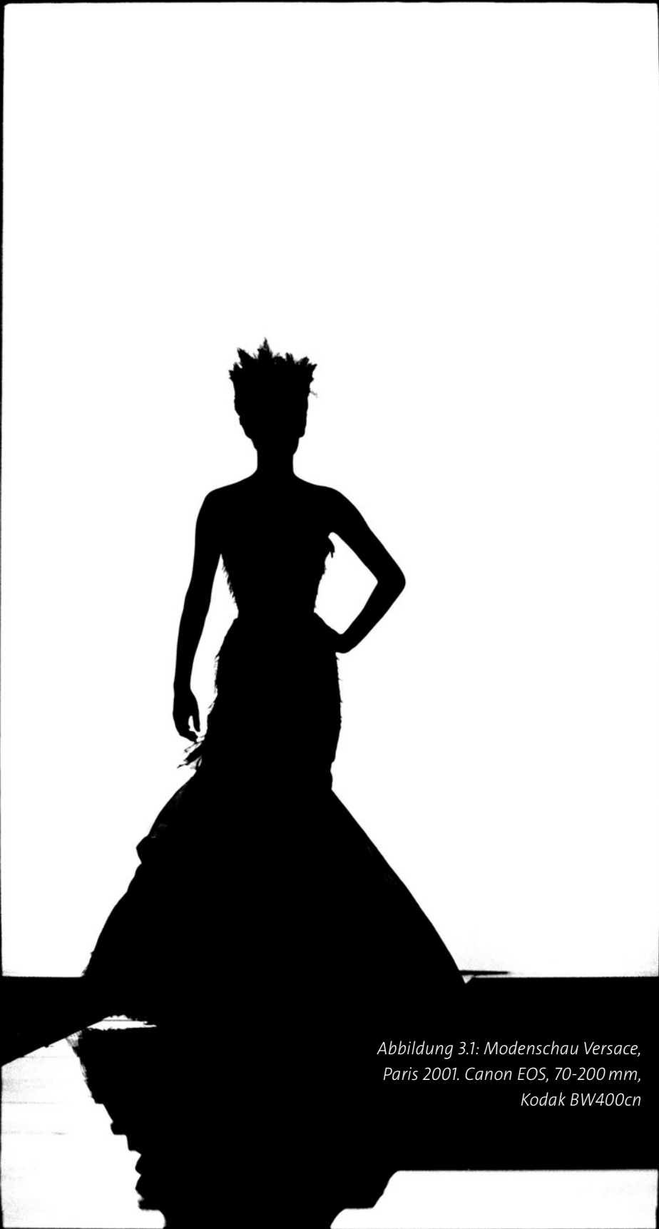
Abbildung 3.1: Modenschau Versace, Paris 2001. Canon EOS, 70-200 mm, Kodak BW400cn