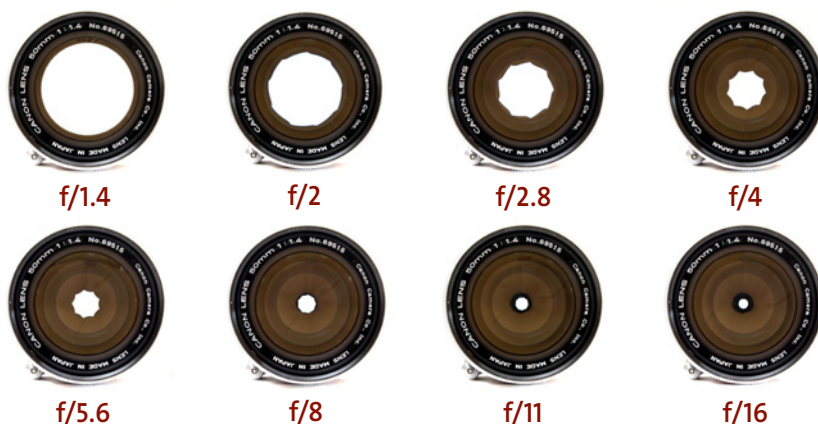
Abbildung 3.6: Mit jedem Schritt hin zu einer höheren Blendenzahl verkleinert sich die Blendenöffnung so, dass nur noch halb so viel Licht hindurchkommt wie bei der Blendenstufe davor.

Die international gebräuchliche Blendenreihe eines 1.4/50-mm-Objektives sieht so aus: