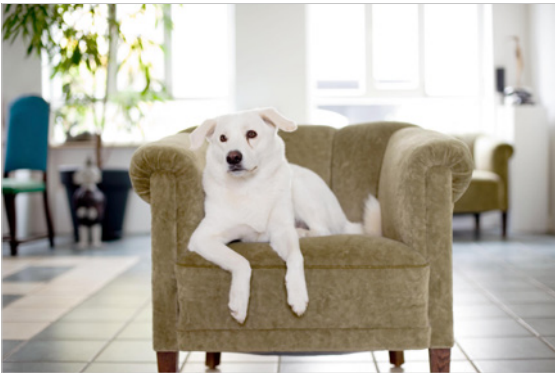
Abbildung 3.3: 50-mm-Standard- objektiv