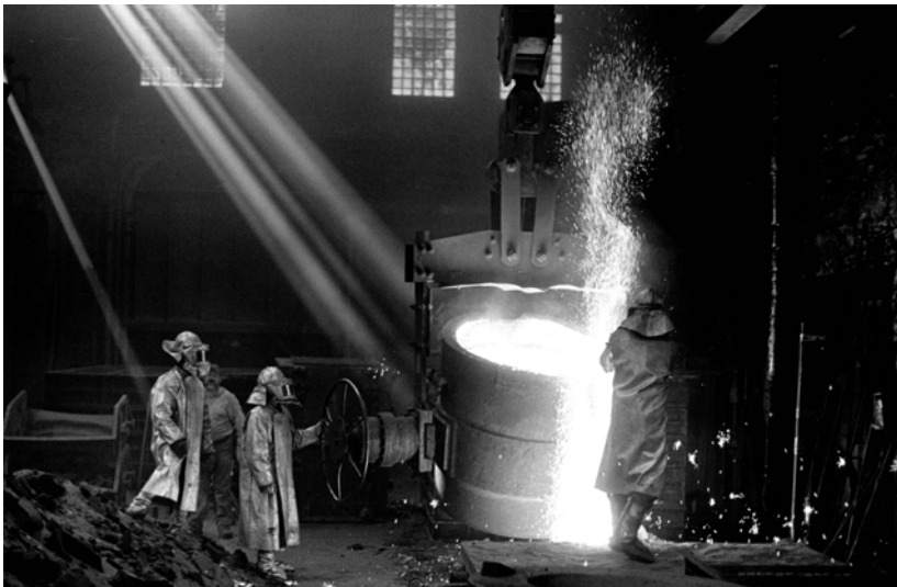
Abbildung 3.7: Gießerei, Göppingen, 2006. Leica, 35 mm, Fuji Neopan 400

Zeigen schließlich die Testnegative keine Auffälligkeiten, hat man eine gute Wahl getroffen. Für welche Brennweite und Lichtstärke man sich entscheidet, bestimmt der Bedarf und der Geldbeutel. Bei einer Kamera mit fest eingebautem Objektiv entfällt diese Überlegung ohnehin.