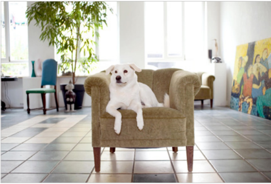
Abbildung 3.2: 35-mm-Weitwinkel- objektiv