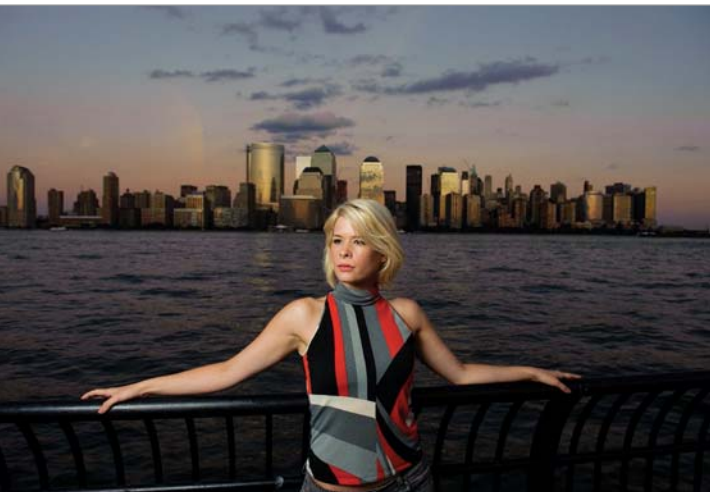
Abbildung 4.7: (1/160 Sekunde, f/5.6, ISO 400)