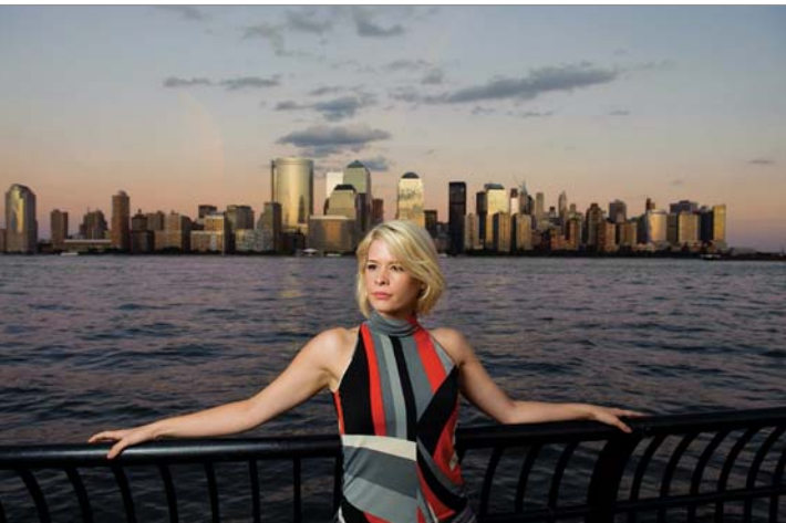
Abbildung 4.8: (1/100 Sekunde, f/5.6, ISO 400)