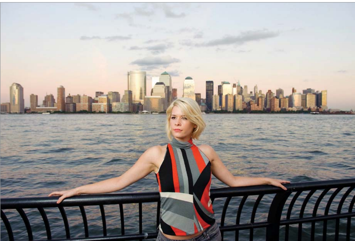
Abbildung 4.10: (1/40 Sekunde, f/5.6, ISO 400)