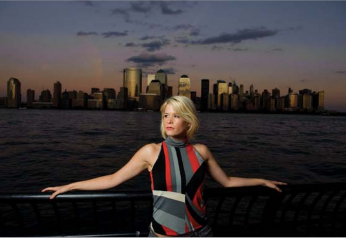
Abbildung 4.6: (1/250 Sekunde, f/5.6, ISO 400)