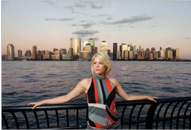
Abbildung 4.9: (1/60 Sekunde, f/5.6, ISO 400)