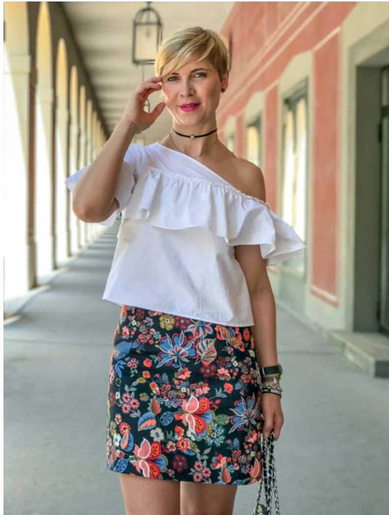
iPhone 7 plus, »Porträt Modus«

Die Profis arbeiten in der Porträtfotografie mit längeren Brennweiten (Teleobjektiven). Verfügt Ihre Smartphone-Kamera über zwei Linsen mit verschiedenen Brennweiten, nutzen Sie unbedingt diejenige mit der längsten Brennweite (in der Kamera-App tippen Sie dazu auf 2x). Damit vermeiden Sie den »Dicke-Nasen-Effekt« und Verzerrungen an den Bildrändern.