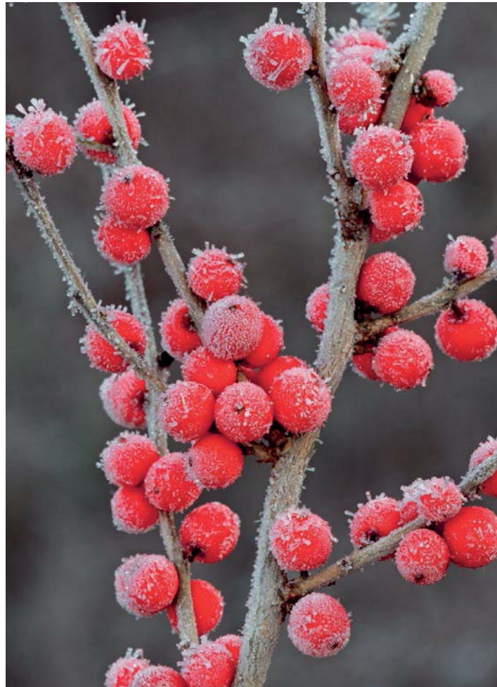
Ein schwacher Aufhellblitz verbessert an einem eiskalten Morgen in Nord-Michigan die Schatten und verstärkt das Glitzern dieser Roten Stechpalme. (Canon EOS-1D Mark III, Canon 180-mm-Makroobjektiv, ISO 100, f/20, 1/2 Sek., Weißabgleich »Schatten«, -1,7 Blenden Blitzbelichtungskorrektur, opt. Canon-Blitzfernsteuerung ST-E2 mit Canon-Blitz 580EX II.)