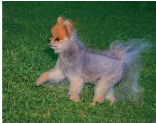
b) Wir schalten auf Blitzauslösung beim zweiten Verschlussvorhang um. Nun blitzt das Gerät nicht zu Beginn, sondern am Ende der Belichtung. So erscheint der laufende Boo Bear klar und deutlich, die Wischspuren auf Basis des Umgebungslichts liegen hinter dem Tier; das wirkt viel natürlicher. (Canon 1DX, Objektiv 70–200 mm bei 144 mm, ISO 400, f/16, 1/5 Sek., Weißabgleich »Bewölkt«, Canon-Blitzgerät 600EX-RT mit +0,7 Blenden Blitzbelichtungskorrektur.)

Damit erhalte ich das gewünschte scharfe Bild von Boo Bear mit nachlaufender Bewegungsunschärfe. Und auch wenn Sie das nicht mit Ihrem ganz eigenen Boo Bear nachspielen können: Die Technik gilt ebenso für Vögel, Flugzeuge, Superman und andere schnelle Motive.