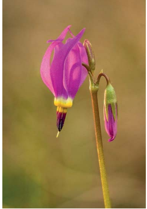
b) Blende f/4.5 zeigt zwar nicht mehr die ganze Blüte scharf, aber der Hintergrund wirkt nun ruhiger. Um diese Götterblume doch vollständig scharf abzubilden, nahm John eine Schärfentiefe-Serie auf (für das sogenannte Focus Stacking). Die Blende f/4.5 führte zu 1/400 Sekunde Belichtungszeit, also schaltete John sein Canon-Blitzgerät 600EX-RT auf Highspeed-Synchronisation (HSS) um und erzeugte ein Gegenlicht. (Canon 5D Mark III, 180-mm-Makroobjektiv, ISO 200, f/4.5 , 1/400 Sek., Weißabgleich »Bewölkt«, -1/3 Blende Blitzbelichtungskorrektur, achteilige Schärfentiefe-Serie montiert mit Software Helicon Focus.)