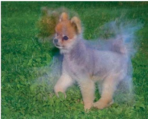
a) Barbaras Boo Bear jagt erfreut nach Hundekekse. Hier belichtet die Kamera wie standardmäßig eingestellt auf den ersten Verschlussvorhang: Der Blitz löst aus, sobald der Sensor komplett freiliegt. Das liefert meist gute Ergebnisse, doch bei Bewegung erscheint hier der scharf dargestellte, angeblitzte Hund irritierend hinter dem verwischten Bild, das durch Umgebungslicht entstand.