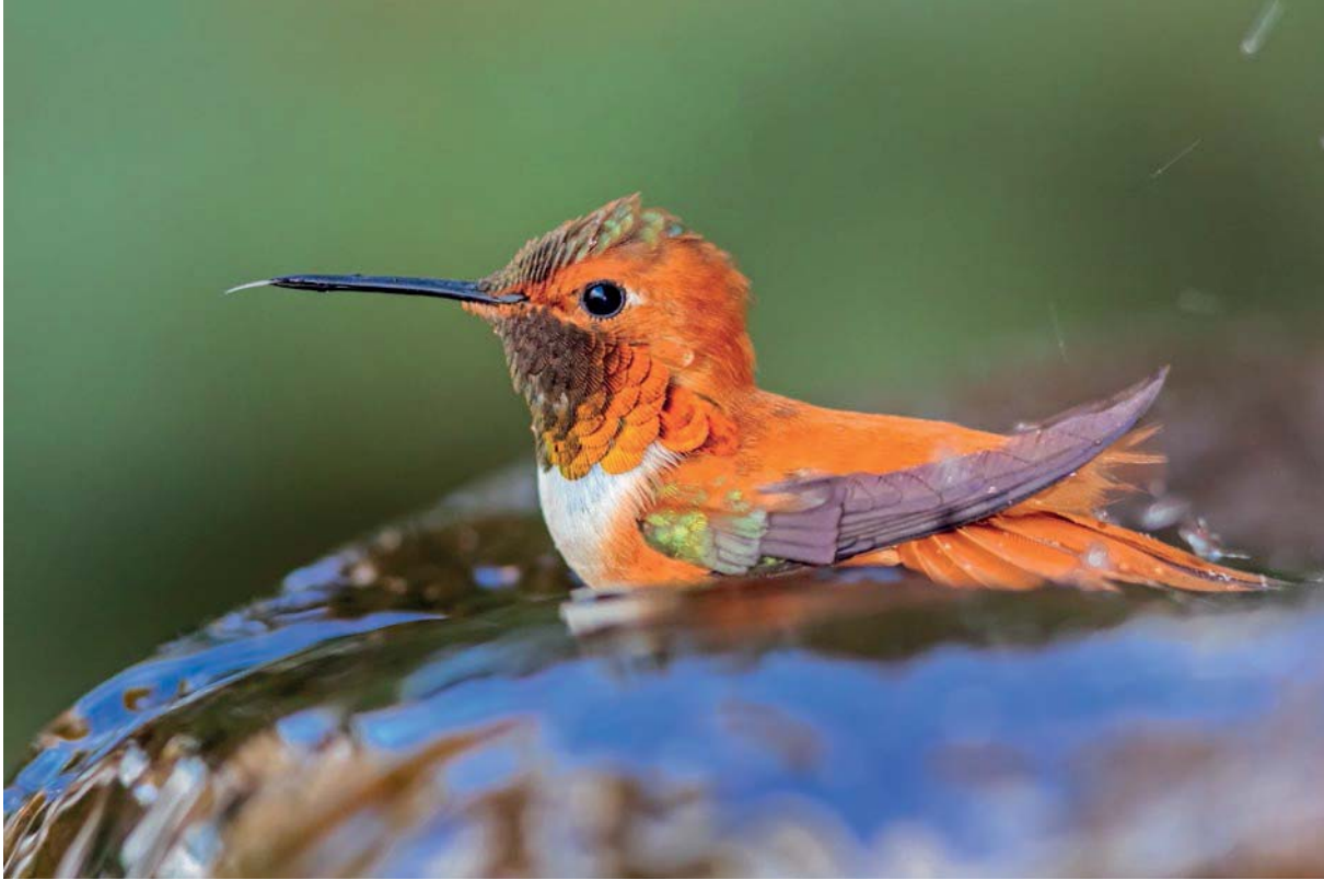
Eine badende Rotrücken-Zimtelfe – hinreißend. Der Aufhellblitz bringt das Auge der Kolibriart zum Funkeln und arbeitet das Gefieder heraus. (Canon 5D Mark III, 300 mm, ISO 3200, f/4.5, 1/200 Sek., aut. Weißabgleich, -2/3 Blende Blitzbelichtungskorrektur.)