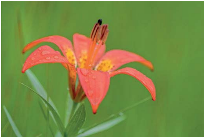
b) Ein Aufhellblitz zeigt diese Lilienart heller und öffnet speziell die Schatten. Um den Hintergrund mit Blende f/4.2 unscharf werden zu lassen, brauchten wir 1/500 Sekunde Verschlusszeit, also kürzer als die kürzeste Blitzsynchronisation. Weil sie die ISO-Zahl nicht weiter reduzieren konnte, schaltete Barbara zur Highspeed-Synchronisation – eine ganze Blitzserie hellte die Blüte auf. Der Modus heißt bei Nikon Auto FP, bei Canon HSS. (Nikon D4, 200 mm, ISO 100, f/4.2 , 1/500 Sek., Weißabgleich »Bewölkter Himmel«, Nikon-Blitzgerät SB-800.)