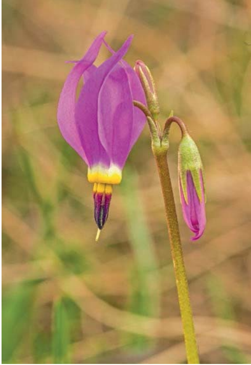
a) Bei Blende f/14 und 1/40 Sekunde stört das vertrocknete Gras im Hintergrund enorm.