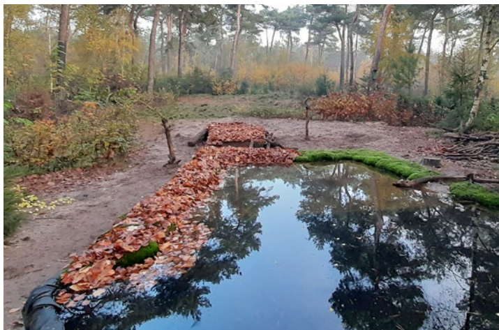
Hier wurden Herbstblätter auf das bemooste Ufer gelegt. Thijs Glastra.

In manchen Hütten gibt es Schwenkköpfe und Bohnensäcke, aber sicherlich nicht in allen. Lesen Sie sich die Informationen, die Sie vom Vermieter erhalten, stets sorgfältig durch, damit Sie wissen, was Sie selbst noch mitnehmen müssen. In jedem Fall müssen Sie für Verpflegung und passende Bekleidung sorgen. Selbst wenn Sie ruhig in einer Hütte sitzen, verbringt Sie doch einen ganzen Tag mit konzentriertem Fotografieren, was definitiv Energie kostet. Im Winter kann es zudem schnell sehr kalt werden, weil Sie sich kaum bewegen. Kümmern Sie sich also um Ihr eigenes Wohlbefinden und tragen Sie lieber eine Schicht Kleidung zu viel als eine zu wenig. Die