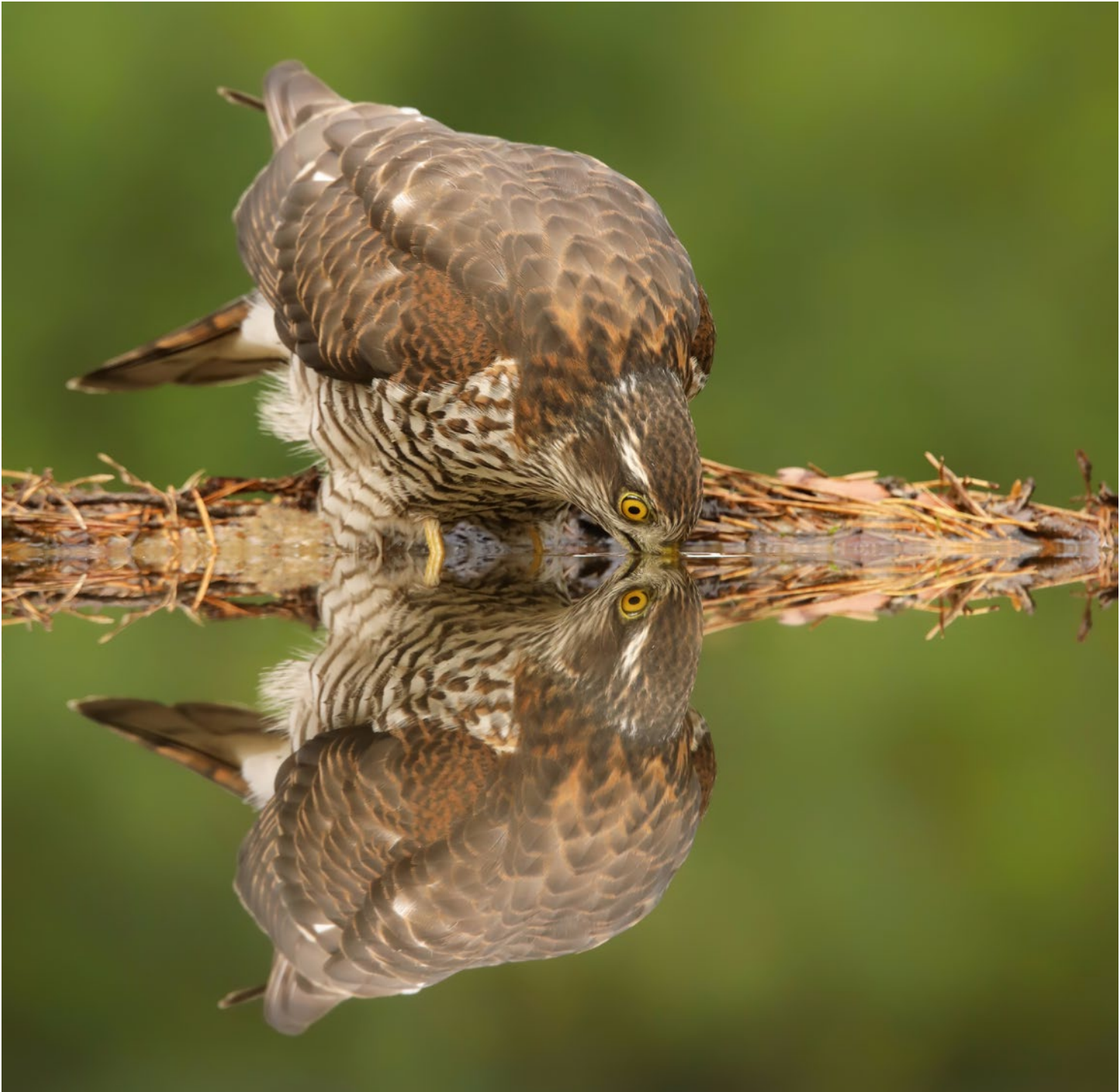
Wenn ein Sperber direkt vor Ihnen ein Bad nimmt, fängt der Auslöser an zu qualmen! Nehmen Sie deshalb immer leere Speicherkarten mit und legen Sie diese rechtzeitig ein, damit Sie nicht im entscheidenden Moment wechseln müssen. Thijs Glastra, 3. Oktober, 534 mm, 1/200 s, Blende 7,1, ISO 1600.