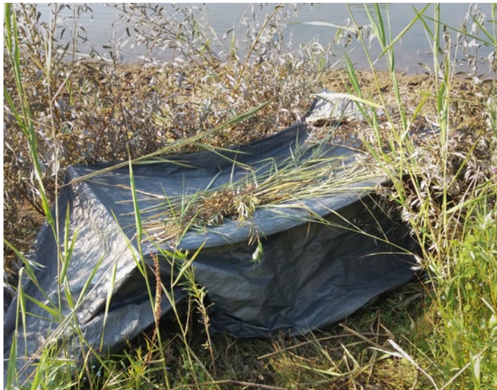
Eine einfache Liegekonstruktion am Teichrand, bestehend aus einer schwarzen Plane und einigen Holzbrettern. Als zusätzliche Tarnung dient Pflanzenmaterial. Einfach, aber funktionell!