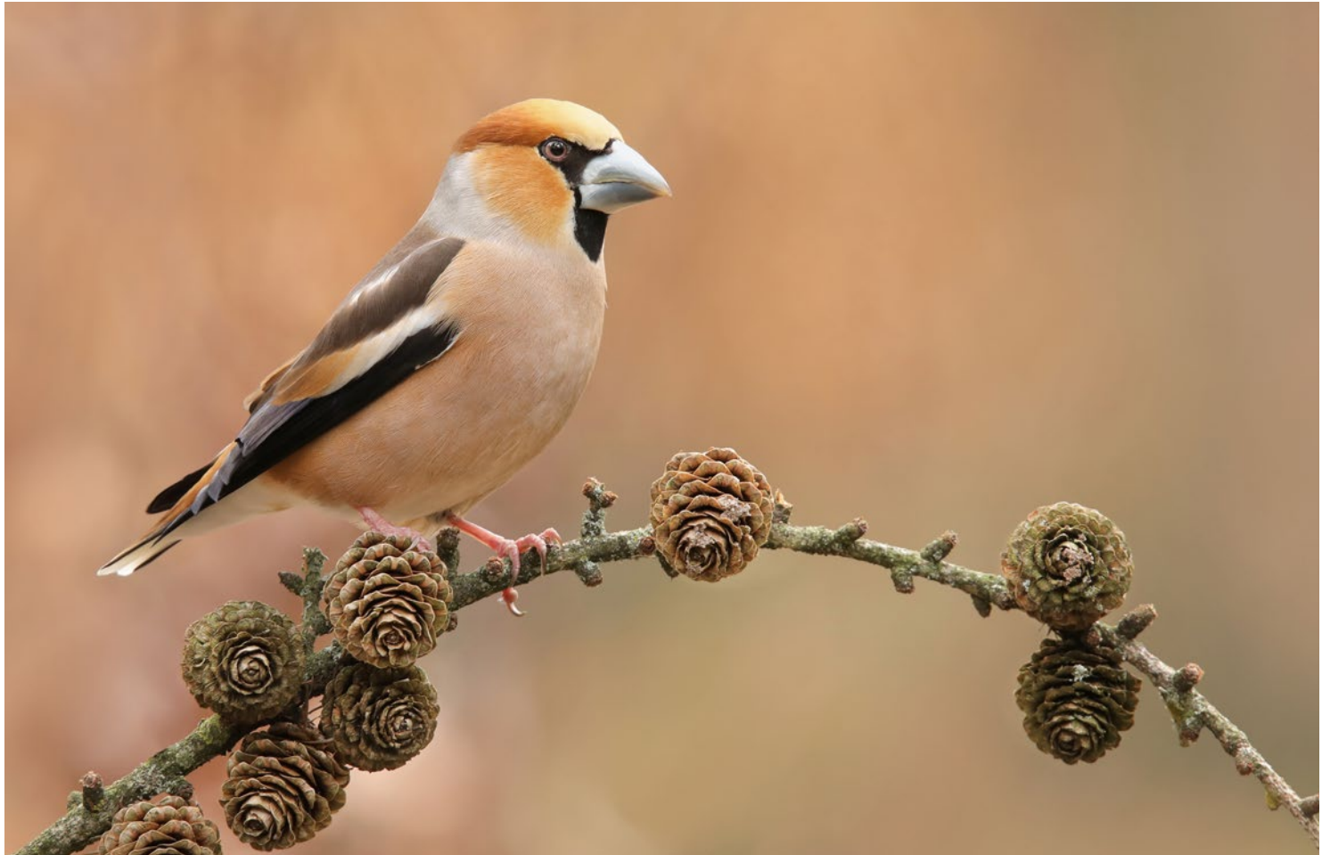
Eine beliebte Art, aus der Tarnhütte heraus fotografiert: der Kernbeißer. Dazu noch ein hübscher Zweig mit Lärchenzapfen – fertig ist das Klischeebild. Heutzutage wirkt das tatsächlich etwas altbacken. Thijs Glastra, 20. März, 600 mm, 1/80s, Blende 7,1, ISO 2500.