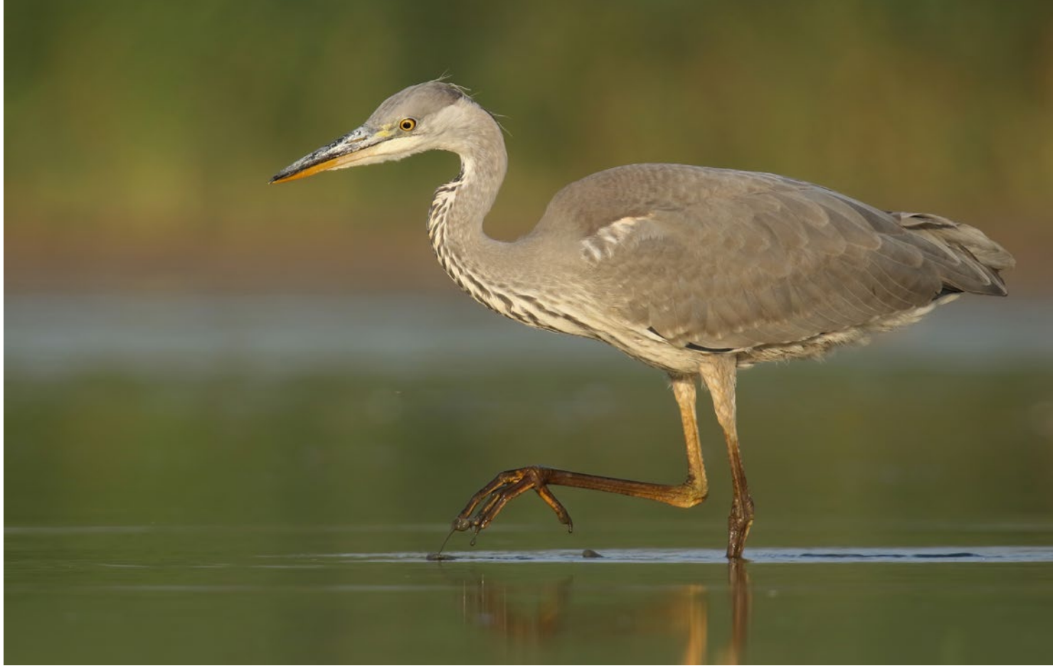
Graureiher, fotografiert von der einfachen Liegehütte aus. Thijs Glastra, 22. Juli, 600 mm, 1/1250 s, Blende 7,1, ISO 800.