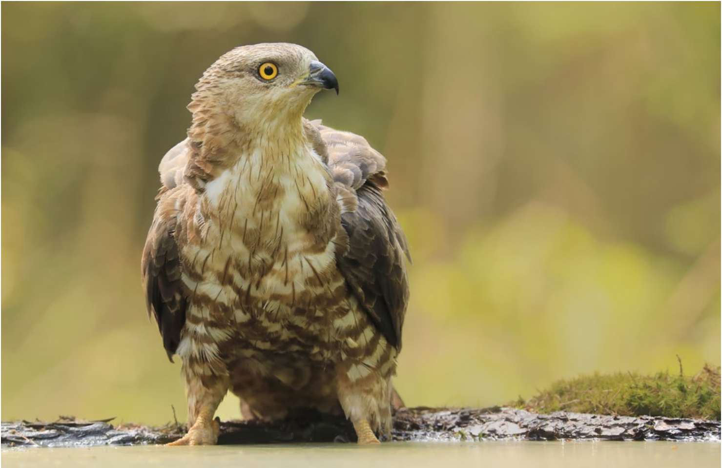
Ein großer Vorteil der Tarnhüttenfotografie besteht darin, dass sich scheue Arten nähern, ohne irgendeinen Verdacht zu schöpfen. Wie dieser Wespenbussard, der an einem warmen Sommertag einen Schluck Wasser trinken wollte. Thijs Glastra, 24. Juli, 450 mm, 1/80 s, Blende 7,1, ISO 1600.