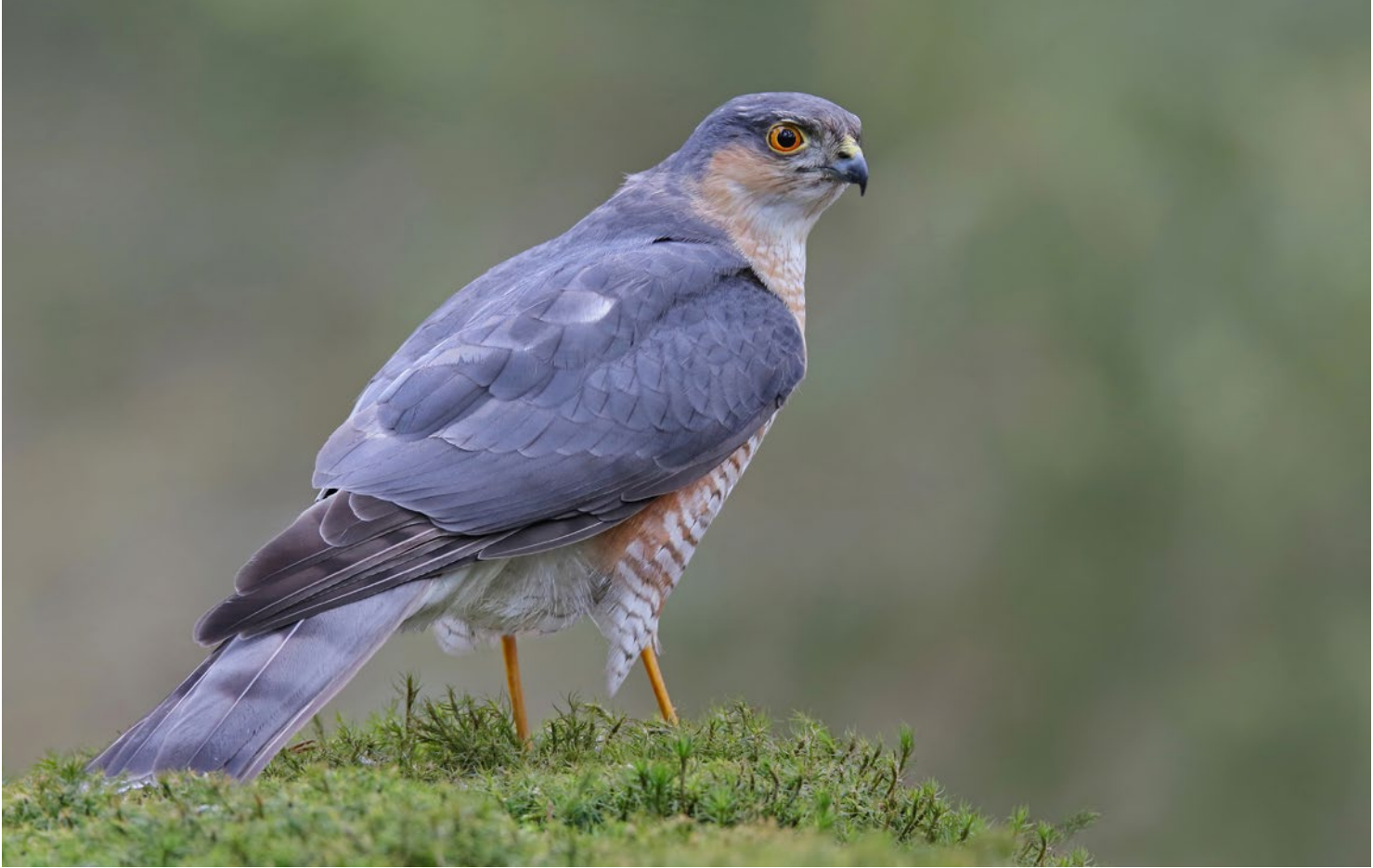
Ein Sperber kann während der Jagd für einen kurzen Moment vor Ihrer Hütte landen. Seien Sie immer wachsam, sonst könnten Sie diesen Augenblick verpassen! Thijs Glastra, 11. März, 470 mm, 1/200s, Blende 7,1, ISO 800.