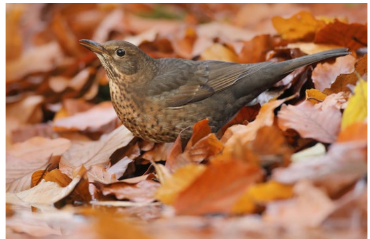
Außer Zweigen können Sie im Herbst auch etwas buntes Laub mitbringen. Wenn Sie die Blätter auf das bemooste Teichufer legen, entsteht ein ganz anderes Bild. Thijs Glastra, 17. November, 500 mm, 1/400 s, Blende 5,0, ISO 1600.

Sie besuchen eine Waldhütte und wollen sich gut vorbereiten? Dann sammeln Sie in der Nähe einige Zweige. Viele Tarnhütten bieten Ihnen die Möglichkeit, Ihr eigenes »Bühnenbild« (Setting) einzurichten, was die Aussicht auf Fotos steigert, die sich von denen Ihrer Vorgänger abheben. An den Hütten selbst liegen übrigens meist genügend aufgeschichtete Zweige, Sie brauchen Ihr Auto also nicht in einen rollenden Miniaturwald zu verwandeln. Allerdings haben Ihre Vorgänger diese Zier-Varianten auch schon benutzt, und Ihr Foto wird daher wahrscheinlich keinen Seltenheitswert haben. Mit eigenen Zweigen können Sie Ihrer Kreativität freien Lauf lassen. Sie sollten jedoch keine Sträucher abholzen, sondern sich auf einen einzelnen Ast oder etwas Totholz beschränken, das auf dem Boden liegt. Oft ist das Sammeln von Zweigen in unmittelbarer Nähe der Hütte auch verboten. Klauten Sie von dort Dekor zusammen, wäre die Gegend bald kahl.