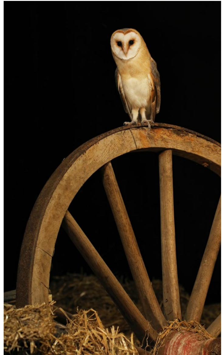
Von einer als Fotoversteck eingerichteten Scheune aus blickt man auf das Obergeschoss eines Heuschobers, in dem Lampen ein Setting für die Schleiereule ausleuchten. Thijs Glastra, 17. Juli, 170 mm, 1/30 s, Blende 5,6, ISO 1600.

Es gibt immer mehr Anbieter von Tarnhütten, die ihre Hütten den Fotografen zu einem bestimmten Preis zur Verfügung stellen. Die meisten Hütten werden für einen Tag gemietet; der übliche Preis liegt zwischen 50 und 100 Euro. Zu zweit oder zu dritt werden solche Tage erschwinglicher (und machen meist auch mehr Spaß), weil man meist einen Festpreis für die Hütte und nicht pro Person bezahlt. Während früher die Tarnhütte im Wald die häufigste Form war, findet man heutzutage Ansitzhütten in allen möglichen Lebensräumen, von der Heide bis zu Feuchtgebieten. Sogar schwimmende Hütten stehen hie und da zur Miete. Diese Vielfalt erweitert das Angebot ungemein! Da für einige Vogelarten eine spezifische Gestaltung und Ausstattung nötig ist, gibt es sogar Hütten, die speziell für das Fotografieren dieser Arten gebaut wurden, wie z. B. für Schleiereulen oder Eisvögel.