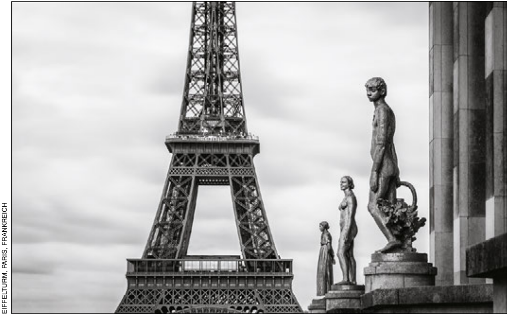
EIFFELTURM, PARIS, FRANKREICH