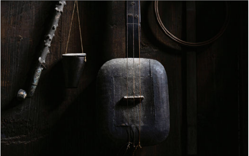
DAXU, GUILIN, CHINA

Licht ist so kraftvoll, dass manchmal nur ein Hauch davon ein spannungsvolles Bild entstehen lassen kann und etwas ganz Gewöhnliches geheimnisvoll oder exotisch wirken kann. Ein Beispiel sind dieses Musikinstrument und die Gerätschaften, die im Haus eines Mannes im ländlichen China an der Wand hängen. Es war das Licht, das meine Aufmerksamkeit erregte – nur ein Anflug sanften Lichts, das durch eine Lücke im Blechdach fiel. Aber gerade dieses kleine bisschen Licht sorgte für Dramatik und Atmosphäre. Wenn Sie durch eine Stadt spazieren, können Sie immer auf solche kleinen, dramatischen Lichtstimmungen achten, weil sie nicht so sehr von einem interessanten Motiv abhängen. Das Licht selbst ist das Motiv.