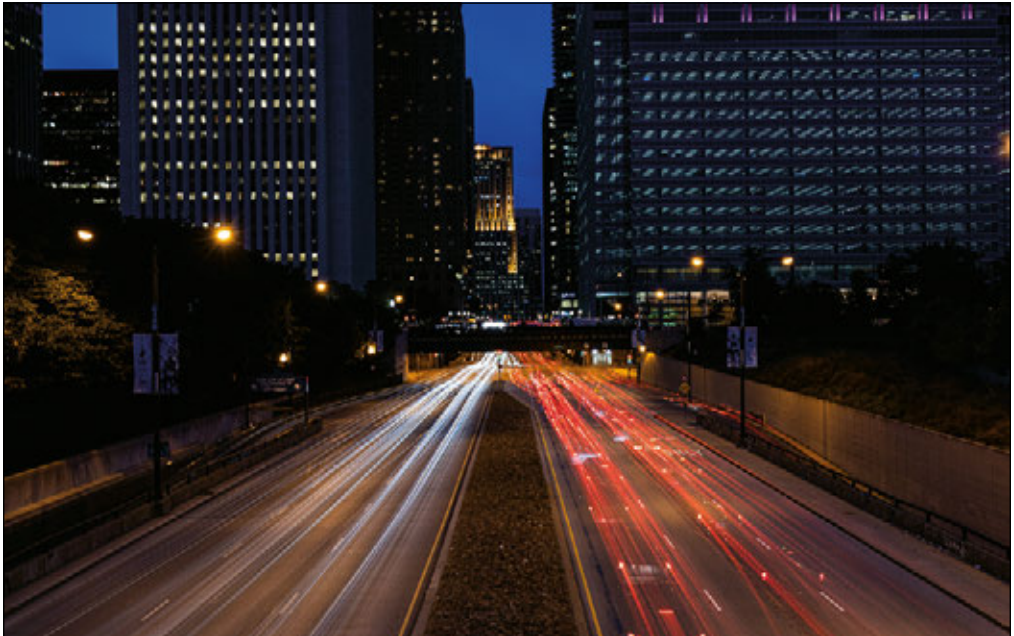
LINCOLN PARK, FUSSGÄNGERBRÜCKE, CHICAGO, ILLINOIS, USA

Durch Bewegung oder Dynamik gelingt es Ihnen leichter, die Aufmerksamkeit der Betrachterinnen und Betrachter zu gewinnen. Dieses Bild ist eine Langzeitbelichtung (die Blende blieb lange geöffnet) von über den Highway rasenden Autos. Genauso gut könnten Sie aber auch ein kleines Tuk-Tuk (also ein winziges, dreirädriges Taxi), ein Kajak auf einem Fluss, eine vorbeifahrende Pferdekutsche oder Kinder, die im Park Fußball spielen, einfangen. Ob Sie das Geschehen einfrieren oder die Bewegung darstellen – beides sind weitere Möglichkeiten, tolle Reisefotos zu machen.