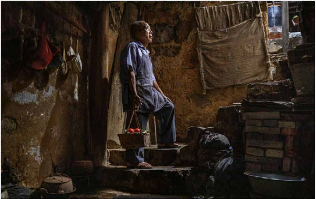
DAXU, GUILIN, CHINA

Wer ist dieser Mann? Wohin geht er? Was trägt er bei sich und hat er es von unten mitgebracht? Wohin schaut er? Woher kommt das Licht? Welche Geschichte erzählt das Bild? Wenn Ihr Foto eine Geschichte erzählt, zieht es die Betrachterinnen und Betrachter in das Bild hinein, während sie versuchen, unmittelbar herauszufinden, was sich dort abspielt. Wenn Ihr Bild den Wunsch weckt, mehr zu erfahren, dann ist Ihnen eine visuelle Geschichte gelungen – einer der heiligen Grale der Reisefotografie. Eine Geschichte zu erzählen, ist einer der stärksten Aspekte der Fotografie – Ihr Bild fesselt uns, zieht uns in seinen Bann und macht uns neugierig auf mehr.