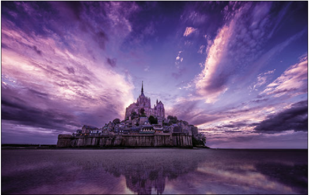
MONT-SAINT-MICHEL, NORMANDIE, FRANKREICH