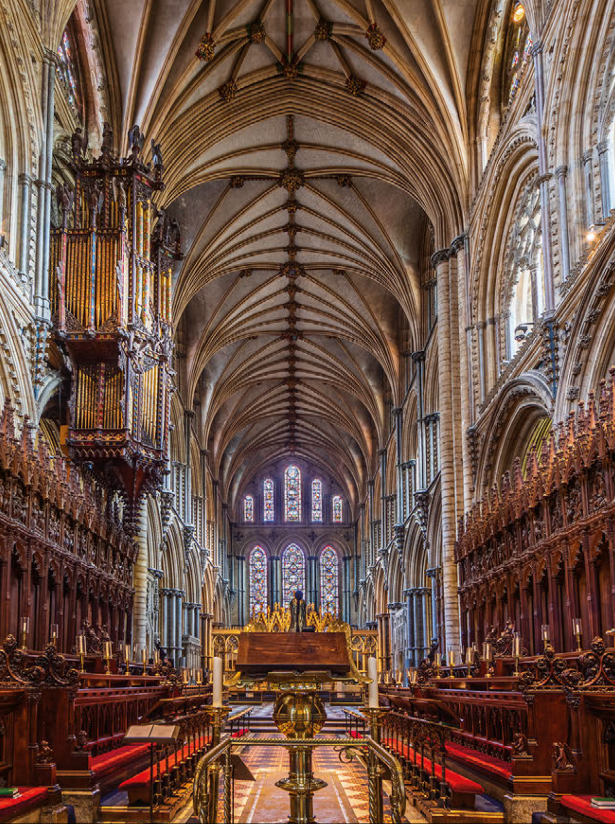
Belichtungszeit: 1.6Sek. | Blende: f/11 | ISO:100 | Brennweite: 14mm Location: Ely Cathedral, Ely, Cambridgeshire, England