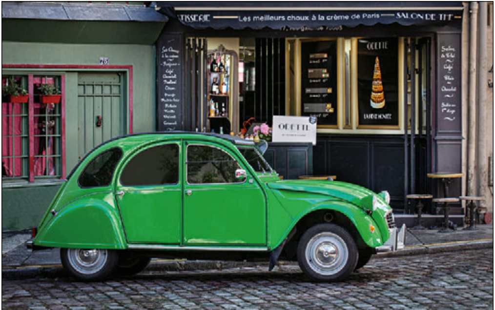
LA MAISON ODETTE - PARIS, FRANKREICH

Einmal ging ich mit meiner Frau an einem kleinen Hafen voller kleiner Boote spazieren. Statt zu fotografieren, ging ich immer weiter den Steg entlang, vorbei an Dutzenden von Booten. Meine Frau blieb stehen, zeigte auf ein Boot und fragte: »Warum nicht dieses Boot, es ist so niedlich?« Ich stimmte ihr zu, es war niedlich, aber ich sagte: »Siehst du den großen Mercury-Marine-Außenbordmotor, der hinten dranhängt? Der ruiniert den Charme und die Romantik der Szene. Ich suche ein malerisches, einfaches Ruderboot. Nur Ruder, kein großer Motor. Keine Flaschen im Boot, kein Radio, keine Plastiktüten. Nichts, was einen Anhaltspunkt für den Zeitpunkt der Aufnahme liefern könnte.« Sie verstand sofort und machte sich mit mir auf die Suche nach diesem bezaubernden Boot. Natürlich kann man auch tolle, absolut moderne Fotos machen, aber damit drückt man dem Bild quasi einen Zeitstempel auf. Wenn Sie Ihr Bild so gestalten, dass keine modernen Schilder oder Fahrzeuge usw. im Hintergrund zu sehen sind, können Sie die Betrachterinnen und Betrachter in eine andere Ära versetzen – voller Charme, Romantik und Interpretationsspielraum. Außerdem macht es einfach Spaß, sich auf die Suche danach zu machen. Natürlich gelingt dies nicht immer, aber wenn Sie eine perfekt zeitlose Szene fotografieren können, hat sich der Mehraufwand schon gelohnt.