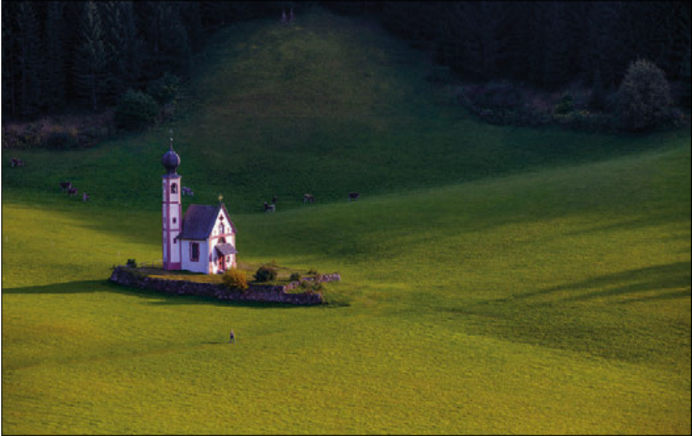
KIRCHE ST. JOHANN, DOLOMITEN, ITALIEN