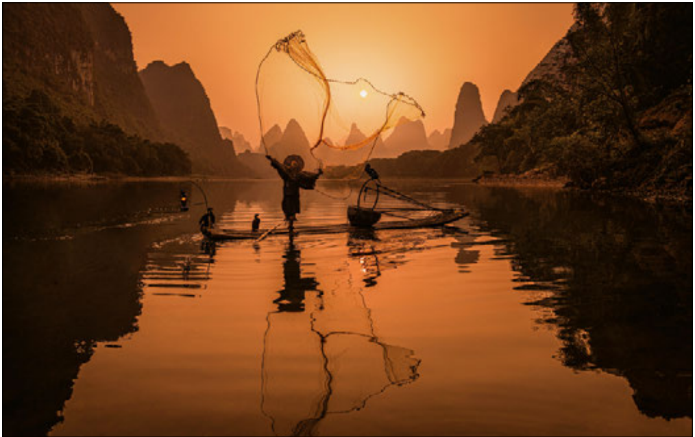
YANGSHUO-REISTERRASSEN, GUILIN, CHINA

Kann Farbe das Motiv eines großartigen Reisefotos sein? Absolut. Wie wäre es mit einem Foto in schönem Morgenlicht? Auf jeden Fall. Oder eine menschliche Gestalt? Klar. Wie Sie in diesem Kapitel gelernt haben, gibt es viele Faktoren, die ein gutes Reisefoto ausmachen. Aber wie wäre es, wenn Sie noch eins draufsetzen und mehrere davon in einem Bild vereinigen? Wie wäre es zum Beispiel mit einem Bild, das in schönem Licht und mit interessanten Farben fotografiert wurde und einen Einheimischen zeigt? So entstehen noch bessere Reisefotos. Wenn Sie das Gelernte kombinieren, können sich die Betrachterinnen und Betrachter in mehrere Aspekte des Bildes verlieben. Nehmen Sie das oben gezeigte Foto. Es vereint so vieles in einer Aufnahme: wunderbare, lebendige Farben; den richtigen Aufnahmezeitpunkt (es wurde kurz nach Sonnenaufgang fotografiert, sodass die Schatten noch weich sind); atmosphärische Effekte (der Dunst am Himmel); ein menschliches Element in Form eines einheimischen Fischers, der sein Netz auswirft (Dynamik), an einem wirklich bemerkenswerten Ort; gründliche Nachbearbeitung (ich habe den Weißabgleich optimiert, damit die Szene wärmer wirkt, den Kontrast erhöht und zum Abschluss alle störenden Objekte aus dem Bild entfernt). Wenn auch Sie es schaffen, all das zu kombinieren, erhalten Sie Bilder voller Intensität und Aussagekraft, die die Betrachterinnen und Betrachter in ihren Bann ziehen.