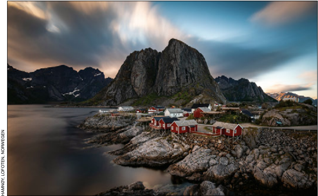
HAMNOY, LOFOTEN, NORWEGEN