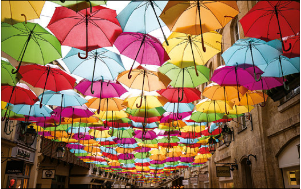
LE ROYAL, PARIS, FRANKREICH

Sobald Sie etwas Einzigartiges, nicht Alltägliches fotografieren können, wie z. B. diese mit bunten Regenschirmen geschmückte Straße, haben Sie gute Aussichten auf einen Volltreffer. Wir Menschen lieben es, Dinge und Orte zu betrachten, die wir noch nie zuvor gesehen haben, und wenn Sie so etwas zeigen können, verleihen Sie Ihrem Bild noch mehr Reiz. Die Szene muss nicht gleich spektakulär sein, nur anders oder ungewöhnlich, ein bisschen aus dem Rahmen fallend – und schon sind Sie auf dem richtigen Weg. Tappen Sie nicht in dieselbe Falle wie viele Fotografinnen und Fotografen, die glauben, dass eine Szene anders oder ungewöhnlich ist, nur weil sie sich in einem fremden Land befindet. Ja, eine kleine Kopfsteinpflastergasse in einem Dorf in der Bretagne sieht tatsächlich ganz anders als bei Ihnen zu Hause, aber das macht sie nicht einzigartig, denn es gibt überall in Europa so viele charmante Dorfstraßen. Suchen Sie nach dem wirklich Einzigartigen und Interessanten und nicht einfach nach einer Szene, die sich von unseren normalen Alltagseindrücken unterscheidet.