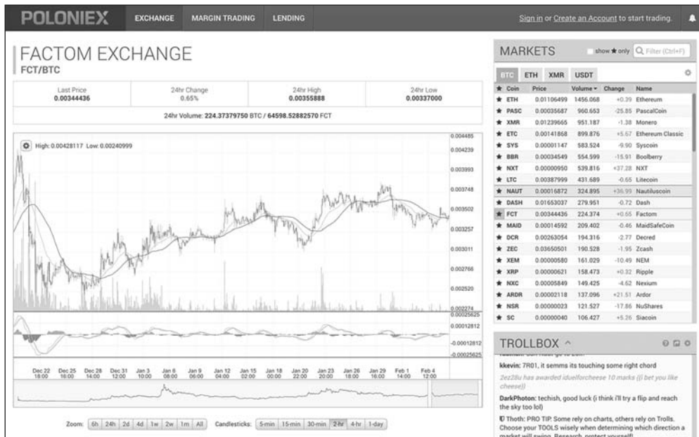
Abbildung 1.3: Die Handelsplattform Altcoin

An Kryptowährungsbörsen finden Sie viele Token dieser öffentlichen Blockchains wieder. Abbildung 1.3 zeigt beispielsweise die Altcoin-Börse für Poloniex ( https://poloniex.com ), eine Handelsplattform für Kryptowährungen.