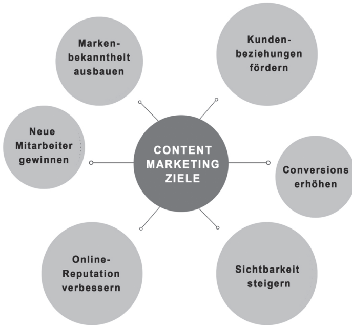
Abbildung 1.3: Legen Sie Ihre Content-Marketing-Ziele fest.

Mehr dazu erfahren Sie in Kapitel 2. Und selbstverständlich muss Ihre Strategie auf Ihre Zielgruppe ausgerichtet sein, wie Sie in dem folgenden Schritt erfahren.