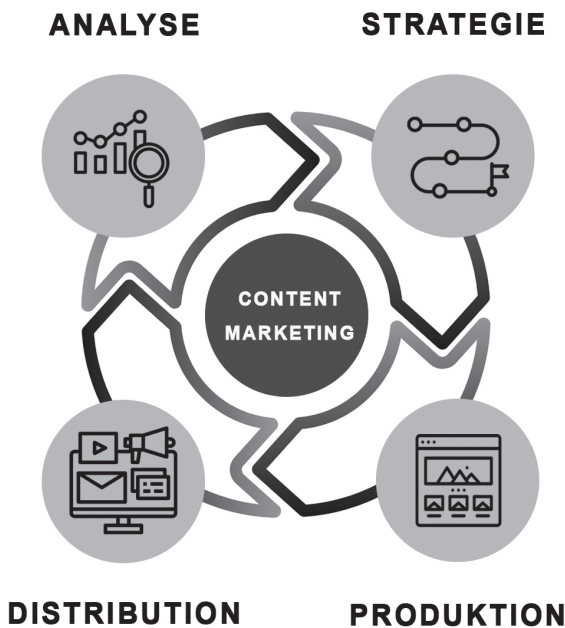
Abbildung 1.2: Der Content-Marketing-Zyklus ist ein Kreislauf bestehend aus den Phasen Strategie / Planung – Produktion – Distribution – Analyse / Optimierung.

Angelehnt an die vier Phasen des Kreislaufs lässt sich die konkrete Umsetzung in sieben Hauptschritte unterteilen: