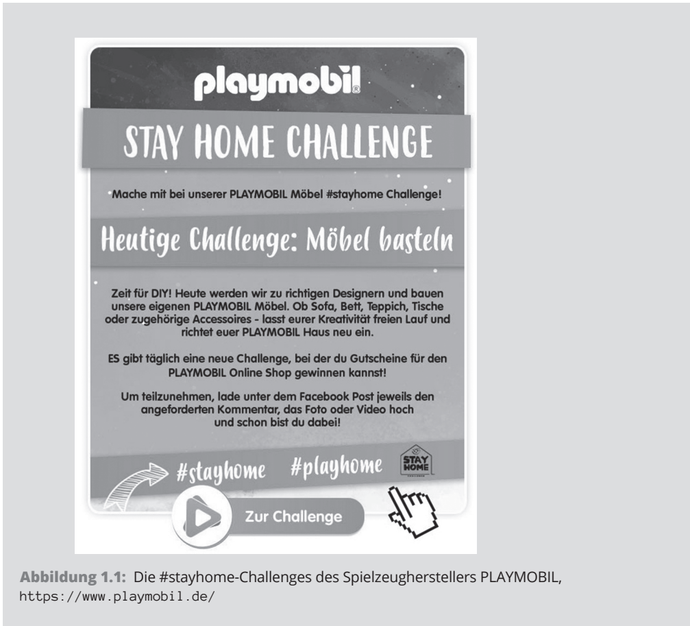
Abbildung 1.1: Die #stayhome-Challenges des Spielzeugherstellers PLAYMOBIL, https://www.playmobil.de/