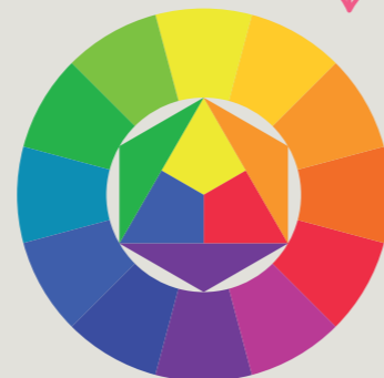
Setzen Sie Farben und Schriften bewusst ein! Lernen Sie, welche Schrift zu Ihrem Entwurf passt und wie Sie Schriften geschickt kombinieren.