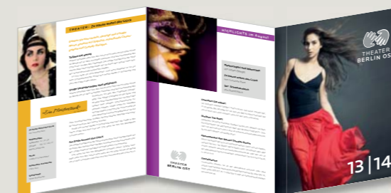
Postkarten, Einladungen, Visitenkarten – jedes Format hat eigene Anforderungen. Die Beispiele zeigen Ihnen, worauf es jeweils ankommt.