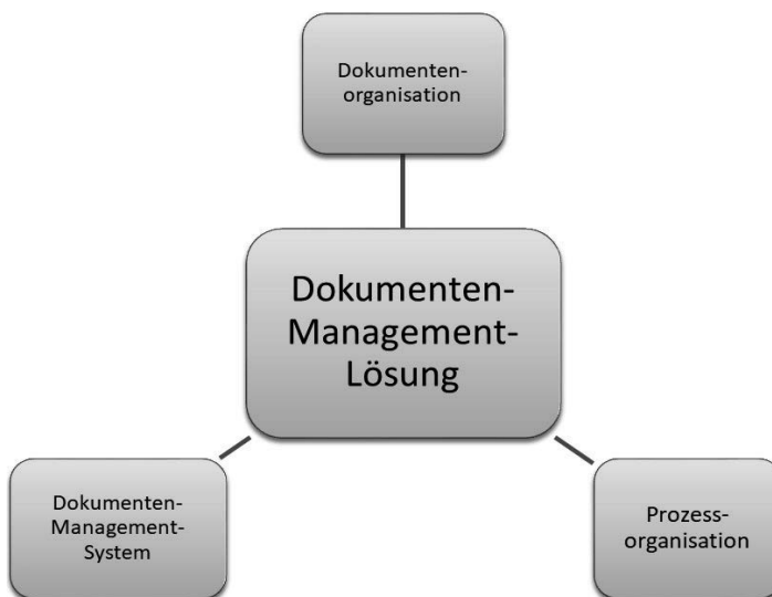
Abb. 1-3 Bestandteile einer Dokumenten-Management-Lösung

Eine Dokumenten-Management-Lösung ist mehr als ein Dokumenten-Management-System. Sie ist letztendlich die Gesamtheit aller organisatorischen Festlegungen, technischen Systeme und deren Zusammenwirken in Bezug auf den Umgang mit den Dokumenten in der betrachteten Organisation. Ein technisches System allein bringt keinen Nutzen. Es ist daher wichtig, sich immer bewusst zu sein, dass ein effektives Dokumenten-Management immer eine auf die eigenen Bedürfnisse zugeschnittene Dokumenten-Management-Lösung ist. Das ist weit aus mehr, als der Kauf eines Dokumenten-Management-Systems!