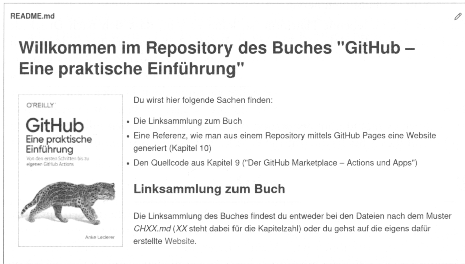
Abbildung 1: Alle Links in diesem Buch sind in dem Repository https://github.com/githubbuch/githubbuch.github.io zu finden.

Dieses Buch enthält viele Links auf andere GitHub-Repositories und Websites. Da einige davon aufwändig abzutippen sind, findest du sie, um dir die Recherche zu erleichtern, auch in diesem Repository auf GitHub: https://github.com/githubbuch/githubbuch.github.io (siehe auch Abbildung 1).