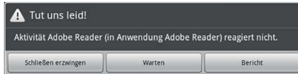
Abbildung 1.2: Hier wird gemeldet, dass eine App nicht mehr reagiert.

gemessenen Zeitrahmens reagiert, wird ein Dialogfeld angezeigt, das den Anwender darüber informiert, dass die App nicht mehr reagiert (siehe Abbildung 1.2). Dann kann der Anwender entscheiden, ob er die App schließen oder auf ihre Wiederherstellung warten will. Größtenteils klicken die Benutzer auf OK und schließen Ihre App.