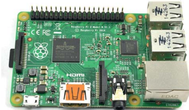
Abb. 1–1 Ein Raspberry Pi 2

Über seinen Ethernetanschluss können Sie den Raspberry Pi auch mit einem Netzwerk verbinden. Sie können aber auch USB-WLAN-Adapter anschließen. Die Stromversorgung erfolgt über eine Micro-USB-Buchse.