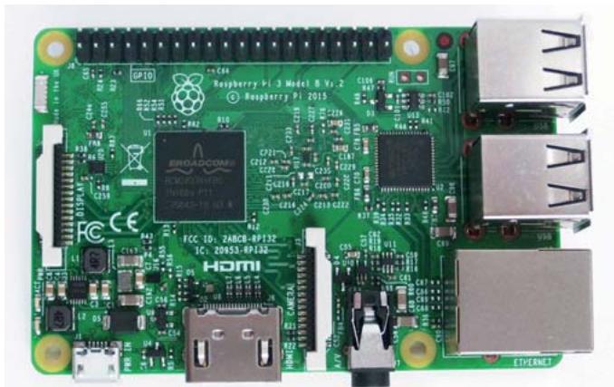
Abb. 1–2 Optisch kaum vom Raspberry Pi 2 zu unterscheiden: das neue Modell 3

Nach Abfassung der Originalausgabe dieses Buches ist das neue Modell Raspberry Pi 3 auf den Markt gekommen.