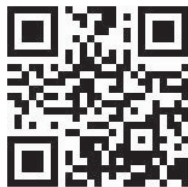
Abb. 7-6 Beispiel QR-Code

Ein einfaches Scannen übernimmt das lästige Eintippen der Daten. Auch die Verwendung von QR-Codes nimmt zu. Diese Punkt-Quadrate können nicht nur eine Zahlenfolge darstellen, sie speichern auch noch mehr Daten.