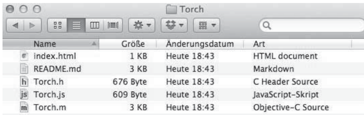
Abb. 7-1 Torch-Plugin-Ordner

Das PhoneGap-Torch-Plugin ist in der offiziellen Plugin-Sammlung 2 erhältlich. Da es sich hier um ein GitHub-Repository handelt, können Sie es wahlweise klonen oder als Zip-Datei herunterladen. Natürlich darf PhoneGap auch nicht fehlen. Für den weiteren Verlauf entpacken Sie bitte die Zip-Datei. Für das folgende Rezept benötigen wir Dateien aus dem Plugin-Ordner Torch. Diesen finden Sie unterhalb des Ordners iPhone in der Zip-Datei bzw. im geklonten Repository.