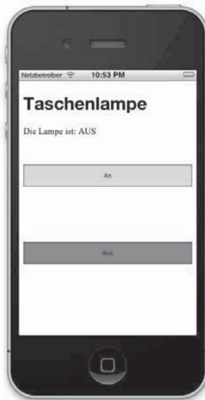
Abb. 7-4 Taschenlampen-Menü

Jetzt ist alles vorbereitet und wartet auf Ausführung. Starten Sie das Erstellen und Deployen auf Ihr angeschlossenes iPhone. Nach kurzer Zeit sollten Sie Folgendes sehen: