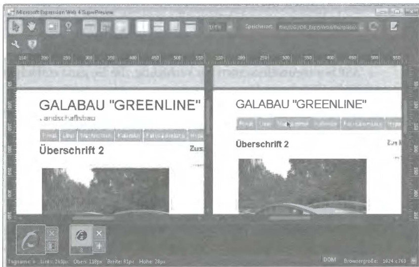
Abbildung E.2: Die SuperPreview ermöglicht den direkten Vergleich der Website in verschiedenen Browsern

Die SuperPreview ist eine neue Browservorschau von Expression Web, die es Ihnen ermöglicht, Ihre Seite auch in Browsern zu testen, die Sie selbst gar nicht installiert haben und die eventuell auch auf anderen Betriebssystemen als Windows laufen. Diese können Sie über einen speziellen Server online testen, und vor allem haben Sie die Möglichkeit, Ihre Seite nebeneinander in verschiedenen Browsern anzeigen zu lassen und so die Anzeige in verschiedenen Browsern zu vergleichen.