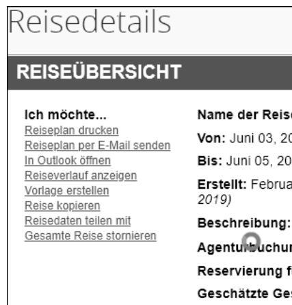
Abbildung 3.31 Optionen in den Reisedetails

Ein Klick auf den Reisenamen zeigt nähere Details und ermöglicht es, diverse Aktionen hierzu auszuführen (siehe Abbildung 3.31).