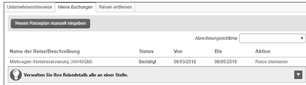
Abbildung 3.30 Alle anstehenden Reisen und Reisen, die noch nicht abgerechnet wurden

Reise stornieren Diese Liste ermöglicht es auch, auf schnelle Art und Weise gebuchte Reisen zu stornieren, indem man einfach neben der aufgeführten Reise auf Reise stornieren klickt (siehe Abbildung 3.30).