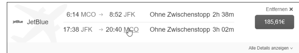
Abbildung 3.13 Beispiel für Flugergebnisse

Die Ansicht jedes Ergebnisses kann erweitert werden, um Alle Details anzuzeigen (siehe Abbildung 3.13), und, falls zugelassen, eine andere Buchungskategorie oder weitere Tariftypen auszuwählen.