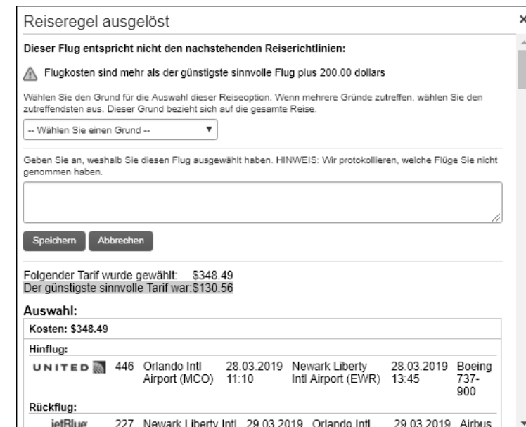
Abbildung 3.14 Auswahl eines vordefinierten Grundes und einer Erklärung bei Verstößen gegen die Reiserichtlinie