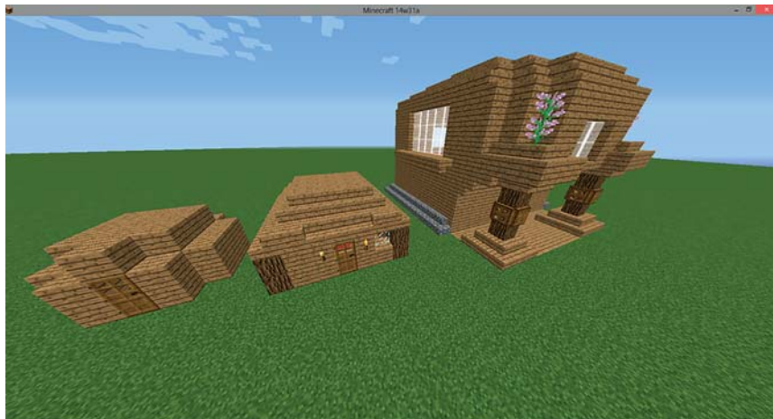
Abbildung 1.2: Drei zunehmend komplexere Gebäude

Abbildung 1.2 zeigt die allmähliche Weiterentwicklung der Baukünste eines Spielers. Links sehen Sie einen Verschlag, der zur Lagerung von Gegenständen und als Nachtlager dient. Das mittlere Gebäude ist ein detailgetreues, aber relativ kleines Haus. Rechts sehen Sie schließlich eine elegante Villa, die viel mehr Details enthält als die beiden ersten Gebäude.