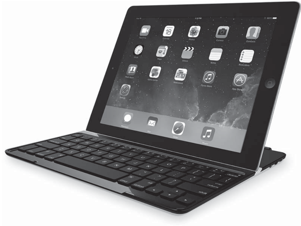
Abbildung 1.3: Logitechs Ultrathin-Tastaturhülle

Wenn Sie die Tastatur doch öfter brauchen, sollten Sie sich eine speziell auf das iPad ausgelegte Bluetooth-Tastatur besorgen, die die iPad-spezifischen Tasten, wie zum Beispiel die Home-Taste besitzt. Logitech wie auch Zagg stellen hervorragende iPad-Tastaturen her, einschließlich einiger Modelle, die sich auch gleichzeitig als Hülle oder Hardcover für Ihr iPad nutzen lassen. Zum Beispiel bietet Logitech die schön gestaltete magnetische Ultrathin-Hülle, wie in Abbildung 1.3 zu sehen, in einer Preisspanne von 80 Euro bis 120 Euro an.