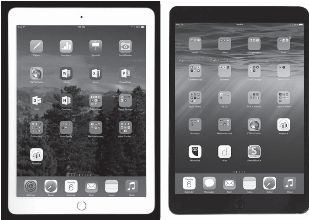
Abbildung 1.1: Das iPad Air (links) und das iPad Mini (rechts) repräsentieren die beiden grundsätzlichen Größen, in denen Apple seine Tablets anbietet.

Wenn Sie häufig reisen und das iPad auf den Flügen zum Schauen von Filmen nutzen wollen, sollten Sie sich beim Kauf des iPads so viel internen Speicher besorgen, wie Sie sich leisten können, da Sie später nichts mehr an der Speicherkonfiguration ändern können. 16 GB sind sicherlich ausreichend, wenn Sie das iPad nur für berufliche Apps, das Lesen von E-Books und das Surfen im Internet nutzen. Wenn Sie aber Ihre Musiksammlung auf dem iPad speichern wollen und eine solide Sammlung von Videos, dann sollten Sie lieber 64 GB nehmen. Wenn Sie Verkäufer sind oder Produkt-Manager, der eine große Anzahl von Präsentationen macht, nehmen Sie mindestens 32 GB – und mehr, wenn Sie es auch als Unterhaltungsgerät nutzen wollen.